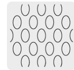
Malla al reverso