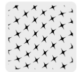
Tejido de punto en bolsas